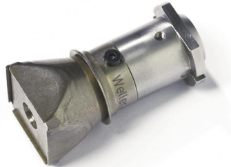
T0058754970 Adattatore NQ