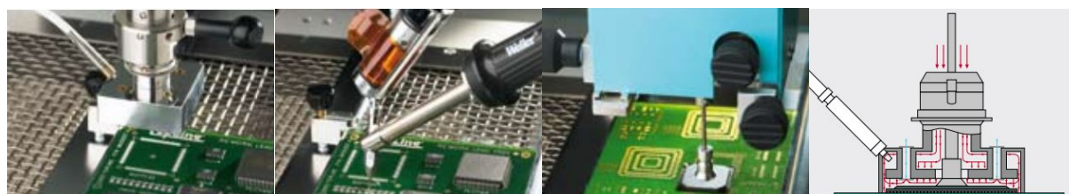
1. Rimozione/dissaldatura del componente difettoso