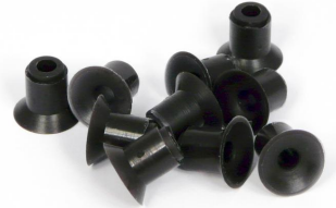
T0058713799 Ventosa Ø 4,5 mm