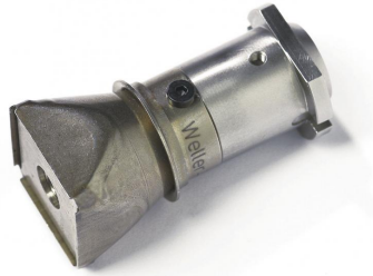
T0058754970 Adattatore NQ