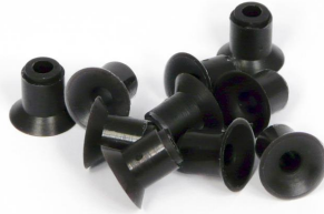
T0058713798 Ventosa Ø 10 mm