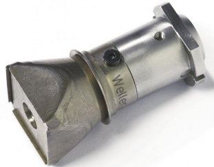
T0058754970 Adattatore NQ