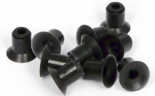
T0058713799 Ventosa Ø 4,5 mm