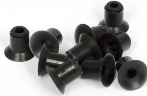
T0058713798 Ventosa Ø 10 mm