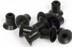
T0058713798 Ventosa Ø 10 mm