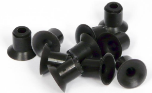
T0058713799 Ventosa Ø 4,5 mm