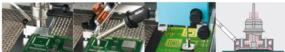
1. Rimozione/dissaldatura del componente difettoso