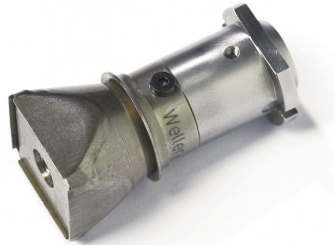
T0058754970 Adattatore NQ