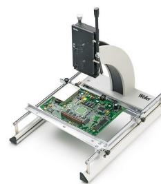
WBHS | Dotazione WHA 3000PS