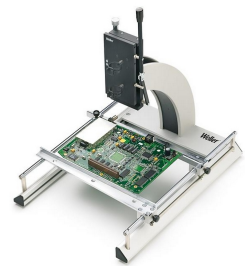
WBHS | Dotazione WHA 3000PS