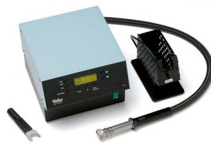
WHA 3000P Set