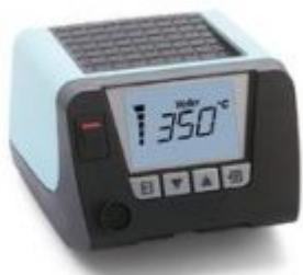
WT1H Unità di controllo a canale singolo 150W