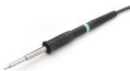
WP120 Saldatore 120W