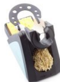
WSR201 Supporto di sicurezza

Guarda tutti i prodotti disponibili >> Stazioni saldanti Weller