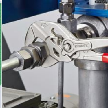
Una pinza chiave a pappagallo può sostituire un intero assortimento di chiavi metriche e in pollici