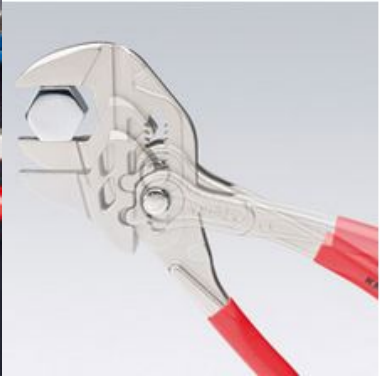
Pinza a pappagallo Knipex: regolazione rapida con pressione sul pulsante