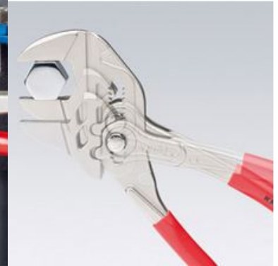
Pinza a pappagallo Knipex: regolazione rapida con pressione sul pulsante