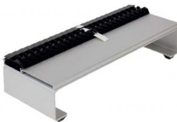
Alimentatore a strisce di nastro