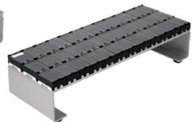
Contenitore di raccolta