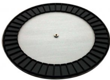
Alimentazione a carosello