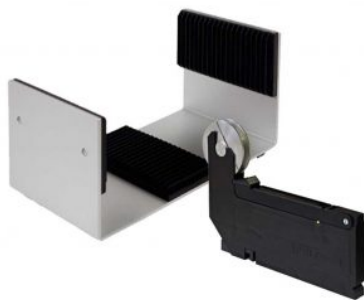
Alimentatore a nastro