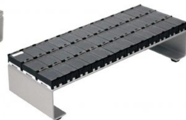
Contenitore di raccolta